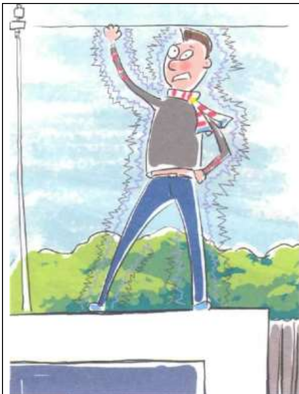
Не поднимайтесь на крыши вагонов!

из вагонов только при полной остановке поезда и не создавая помех другим пассажирам