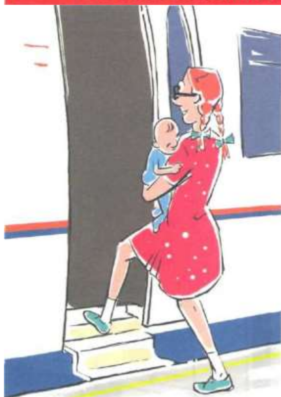
Садитесь или выходите из вагона, держа детей за руку или на руках

Помогайте пожилым людям, беременным, гражданам с детьми и людям с ограниченными физическими возможностями